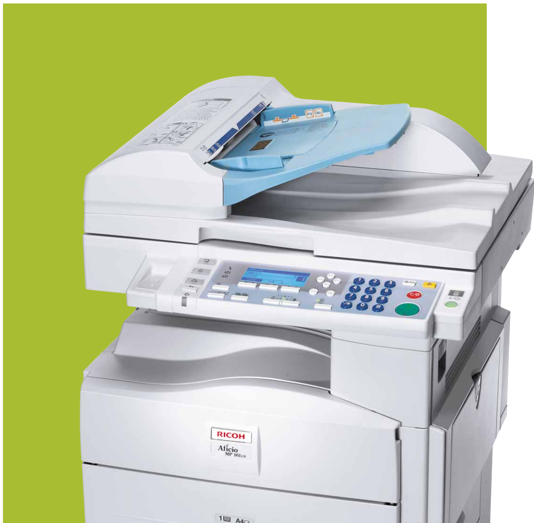
Aficio™ MP 161/MP 161L/MP 161LN